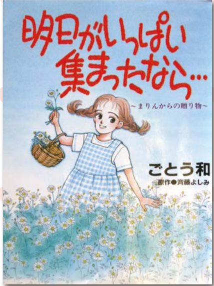
「明日がいっぱい集まったなら...」 ~まりんからの贈り物~ ごとう和 (中学生以上向き)