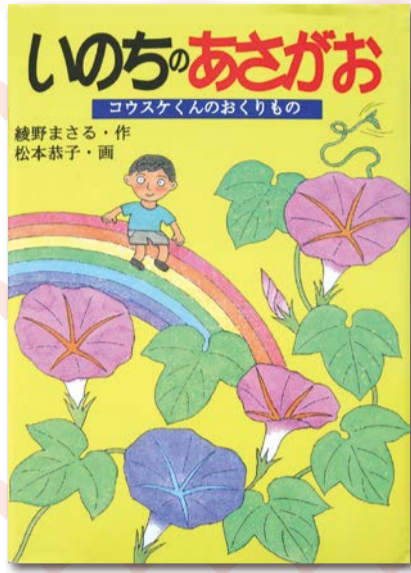
「いのちのあさがお」 綾野まさる (小学校低学年以上向き)

骨髓バンクに関する課題書籍の感想文を1200字以内(題名、学校名、学年、氏名含む)にまとめてください。 推奨学年は明記してありますが、学年に関わらず自由に選んでください。