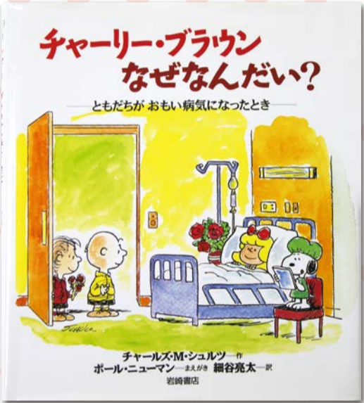
「チャーリー・ブラウンなぜなんだい?」 ~ともだちがおもい病気になる時~ チャールズ・M・シュルツ (小学生からおとな向き)